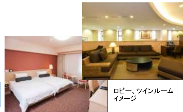
ロビー、ツインルームイメージ