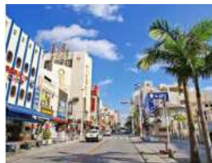
国際通り(イメージ)