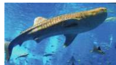
一度は訪れたい「美ら海水族館」