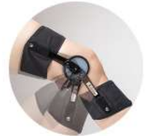
軽くて、 履き心地抜群