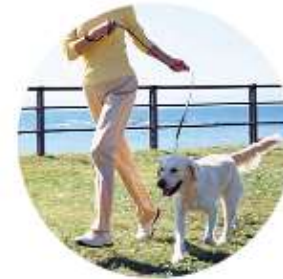
痛みが和らぎ、 楽に歩けます

独自の特許技術に基づき製造されるセンターブリッジ（Center Bridge : CB）により、支持性（強度）を落とすことなく世界最軽量化（約79g／フレームのみ）を実現。痛みもなくトレーニングできる、むしろCBブレースを装着した足の方が軽く感じられるなどの好評をいただいております。