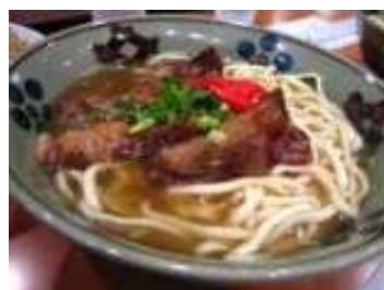
沖縄そば(イメージ)