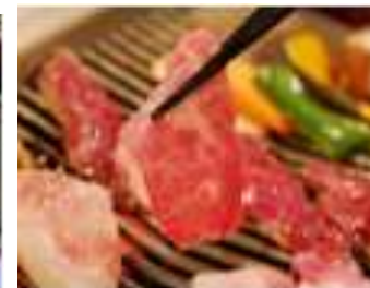
石垣牛とあぐーランチ(イメージ)