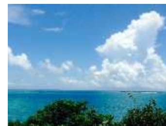
本島中部の美しい海と空。のんびり絶景ドライブもお楽しみください。 (※イメージ)